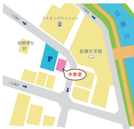
本教室（前橋市千代田町3-8-9）