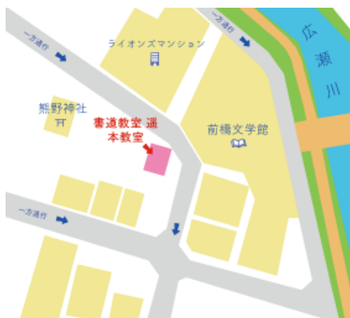
本教室（前橋市千代田町3-8-9）